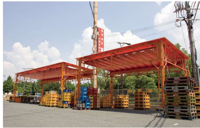
サイズ W:12mxD:4.2m×H:3.0m (有効) W:7.0mxD:4.2m×H:3.0m (有効) オプション コンクリートウェイト