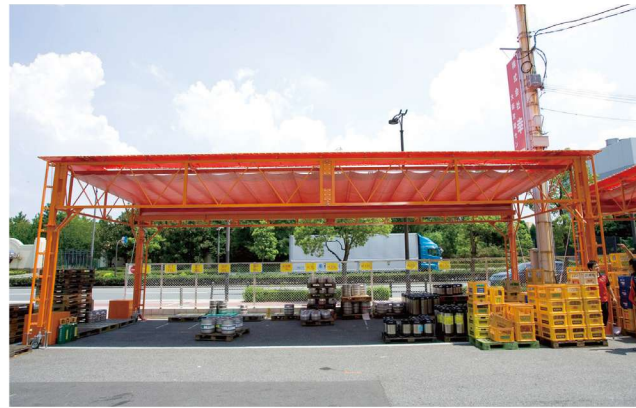
サイズ W:12mxD:4.2m×H:3.0m (有効) W:7.0mxD:4.2m×H:3.0m (有効) オプション コンクリートウェイト