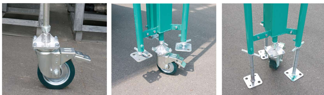
ストッパー付自在輪 200mm