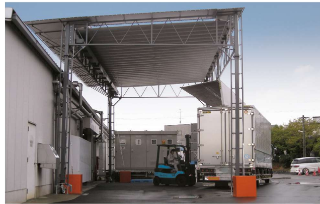
サイズ W:12mxD:6.0m×H:5.2m (有効)