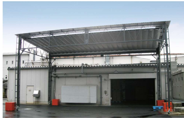
オプション コンクリートウェイト